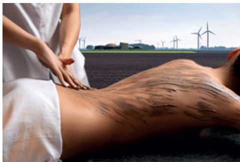
Mud Spa Lely, Landschap van S-curves en innovatie