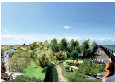
Wonen met de kracht van de eilanden