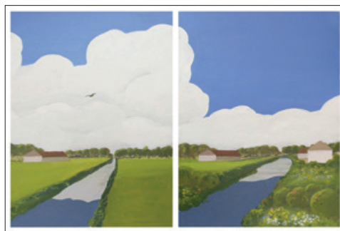
Stroomopwaarts! Eén beek; één gemeenschap