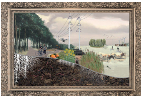
Bouwen op 'goeie' gronden