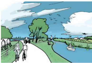
VIVA AB AQUA