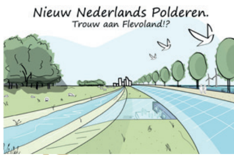
Nieuw Nederlands Polderen. Trouw aan Flevoland?!