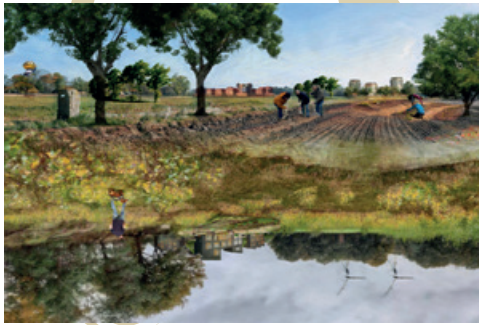
[ge]WOON gelukkig in de 8RHK