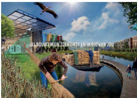
Jij bouwt mijn toekomst en ik die van jou