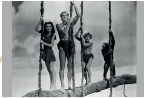
Groene Vingers Groene Hersens