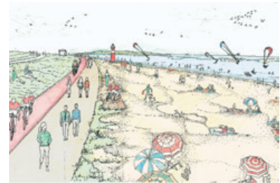
De Scheldedemonding als meervoudige ontwerpogave