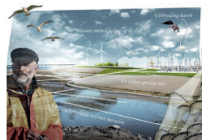
Zout Zeeland, Zoet Holland. Daar willen we wonen!