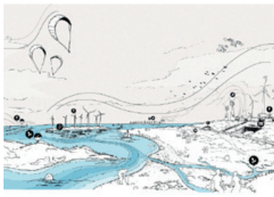
een toekomst vol energie