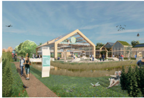
Pioneering the future on the biobased campus Dronen